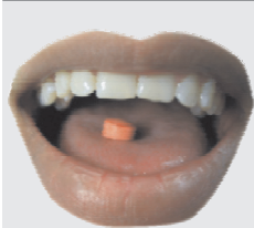
Utilizar pastillas reveladoras

La placa bacteriana es invisible pero se puede detectar utilizando pastillas reveladoras ó colorante vegetal, como betabel, moras o azul añil. Esta tinción se puede eliminar mediante el barrido de la placa bacteriana con cepillo e hilo dental.